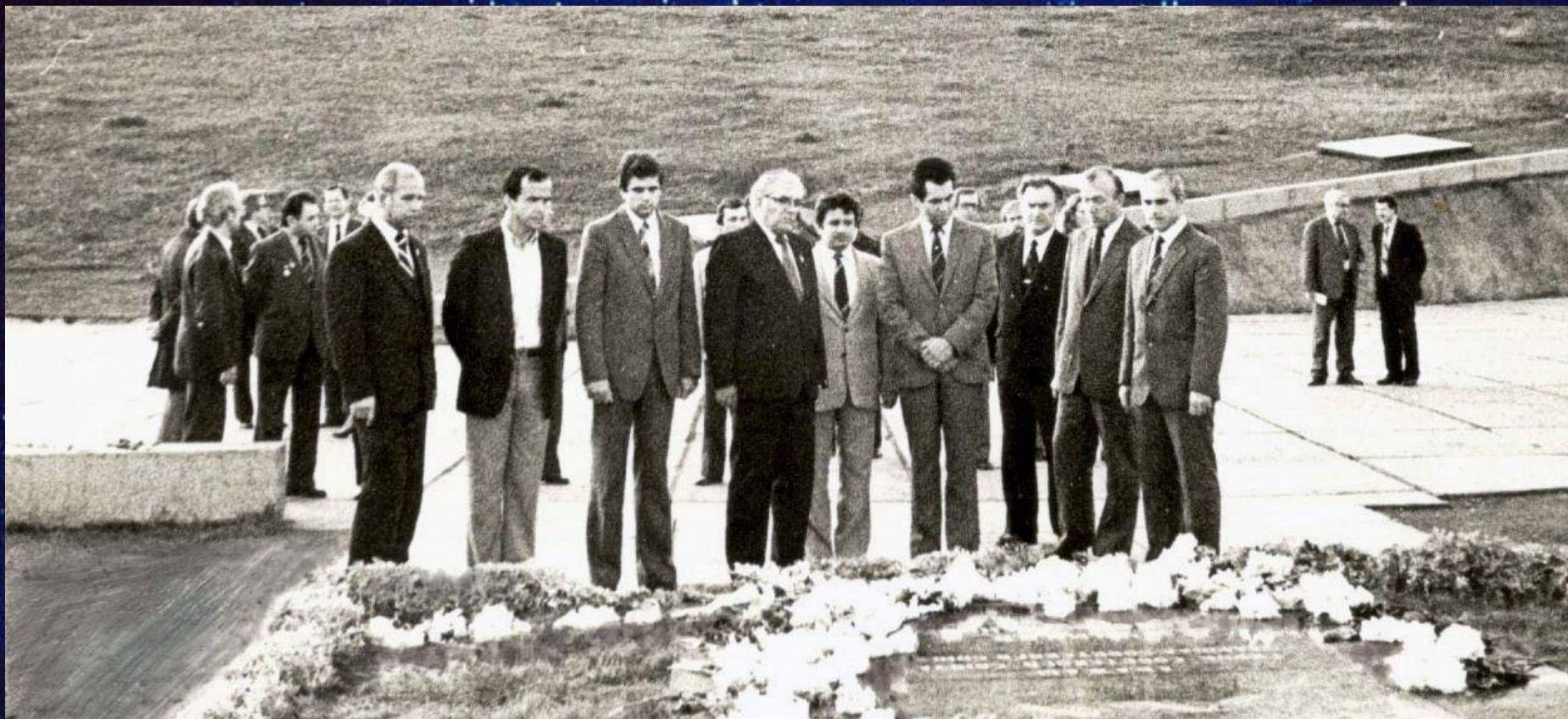
Делегация советско-французских космических экипажей на Мамаевом кургане, г. Волгоград, 1982 г. // Ф. 13226. Оп. 1. Д. 793.