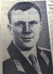
Сергей Илья ТАСС О ПЕРВОМ В МИРЕ ПОЛЕТ ЧЕЛОВЕКА В КОСМИЧЕСКОЕ ПРОСТРАНСТВО 12 апреля 1961 года, в Советском Союзе выведен