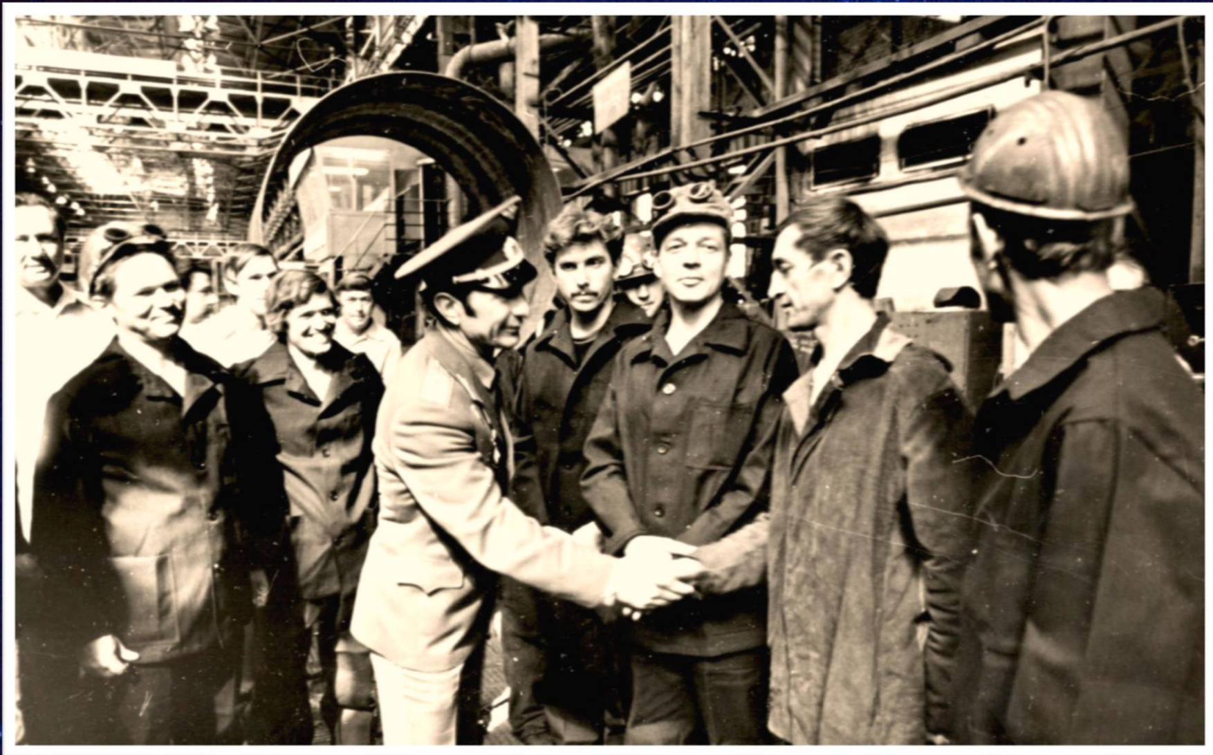
Летчик-космонавт СССР Ю.В. Малышев знакомится с членами бригады котельщиков КСЦ-1 завода им. Петрова, зачислившими его Почетным котельщиком бригады. Волгоград, 1980 г. //