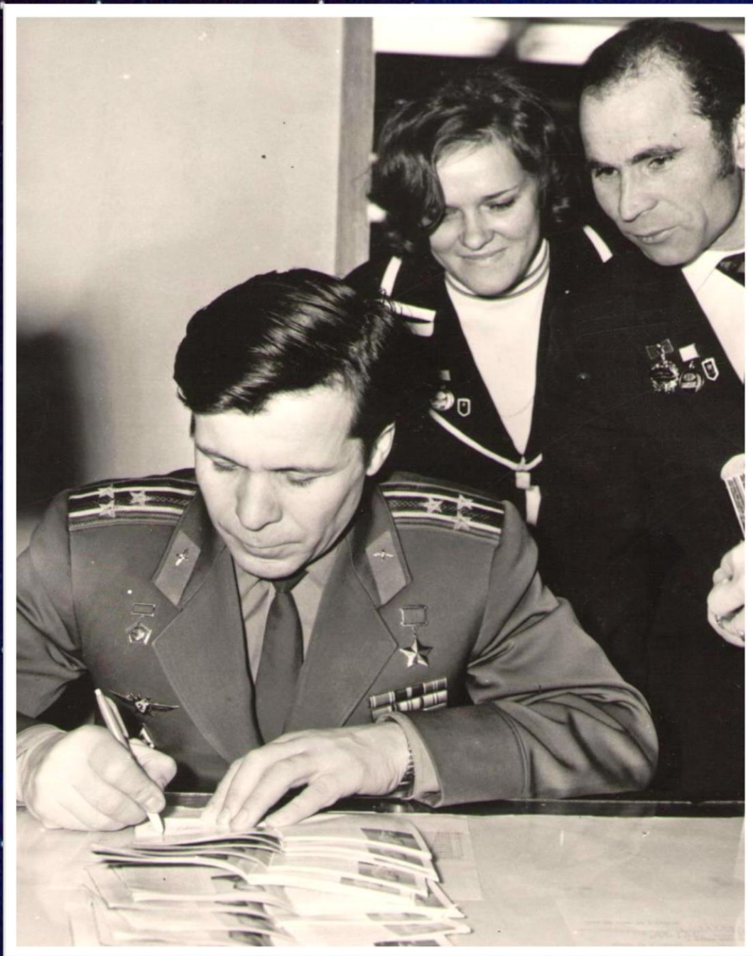
Летчик-космонавт Евгений Васильевич Хрунов дает автографы. 21 декабря 1973 г. // Ф. 13226. Оп. 1. Д. 2658.