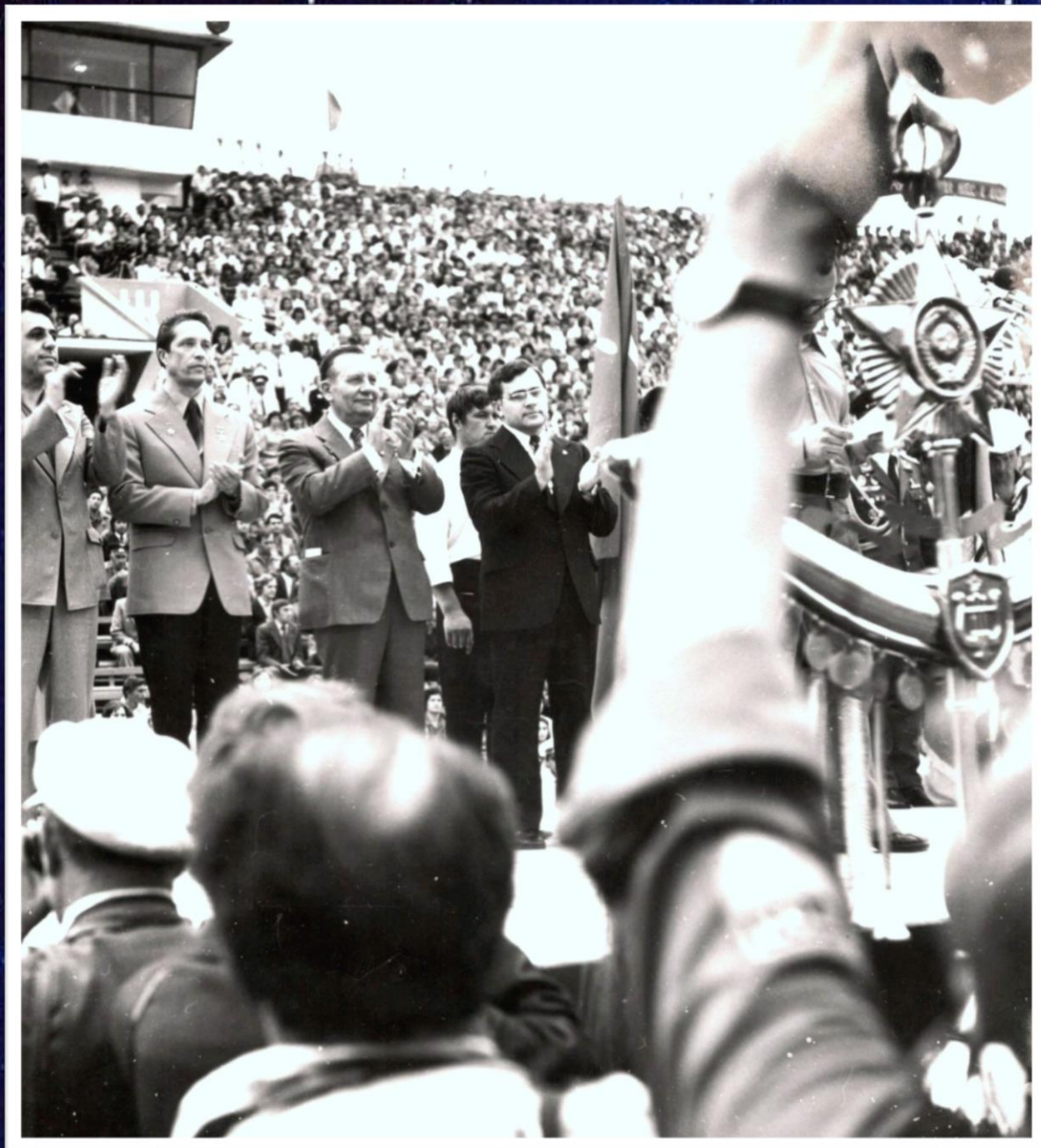
Владимир Викторович Аксенов (второй слева) – летчик- космонавт, Герой Советского Союза на открытии фестиваля дружбы молодежи СССР и ГДР на Центральном стадионе г. Волгоград, 1977 г. // Ф. 13226 Оп. 1. Д. 538. Л. 1.