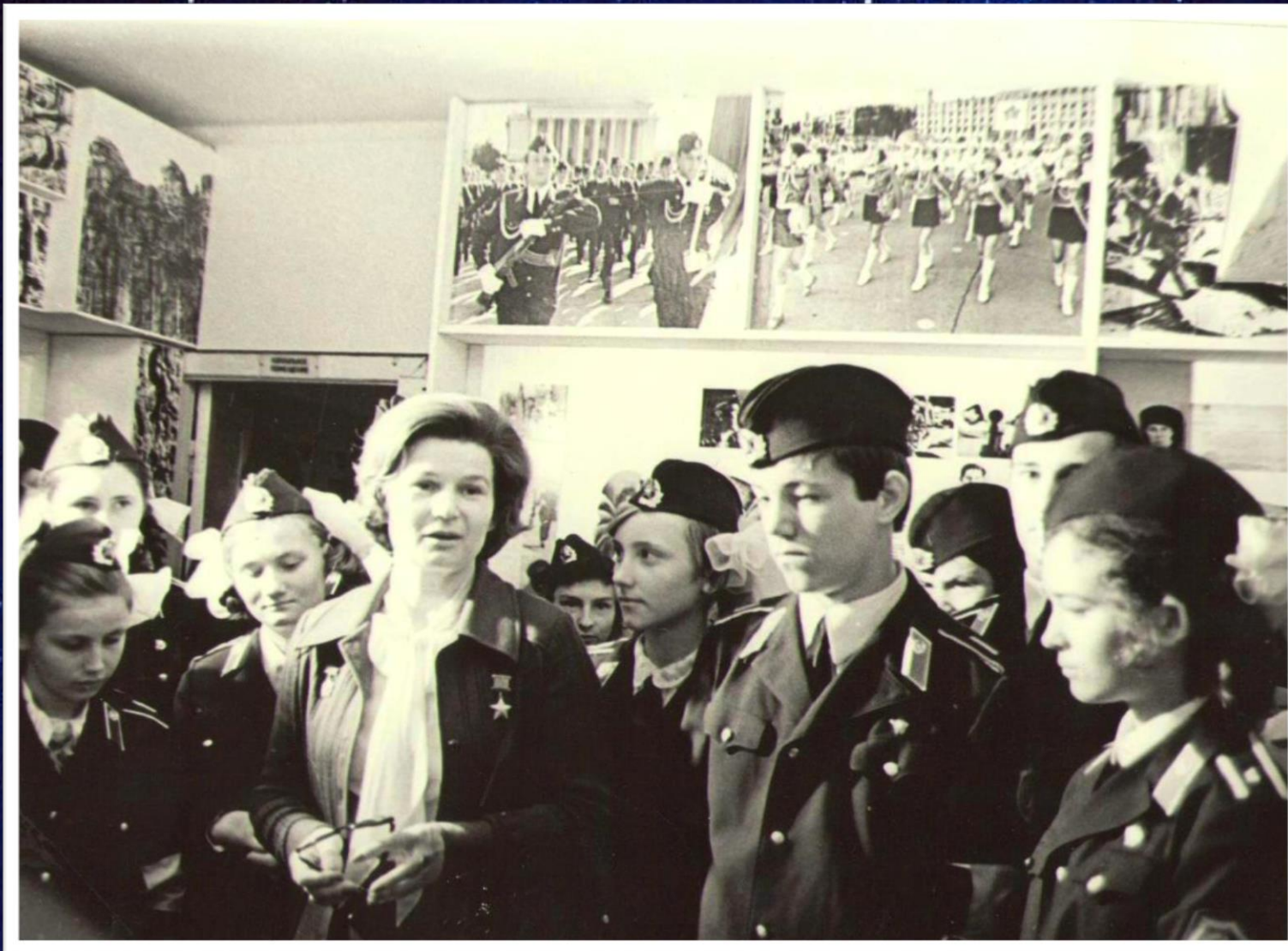
Летчик-космонавт СССР, Герой Советского Союза, председатель Комитета советских женщин В.В. Николаева-Терешкова в гостях у пионеров поста № 1. г. Волгоград, 1976 г. // Ф. 13226. Оп. 1. Д. 2010. Л. 1.