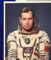
Юрий Гагарин 12 апреля 1961 года первый человек в космосе