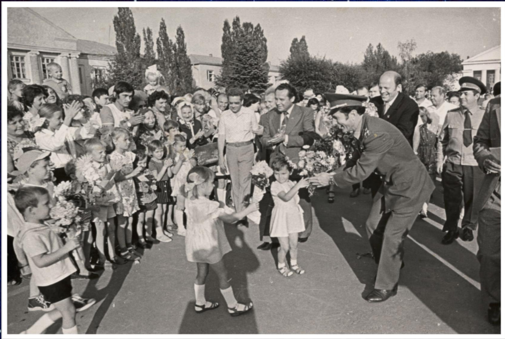
Летчик-космонавт, дважды Герой Советского Союза Ю.В. Малышев. 1984 г. // Ф. 13226. Оп. 1. Д. 2035. Л. 6.