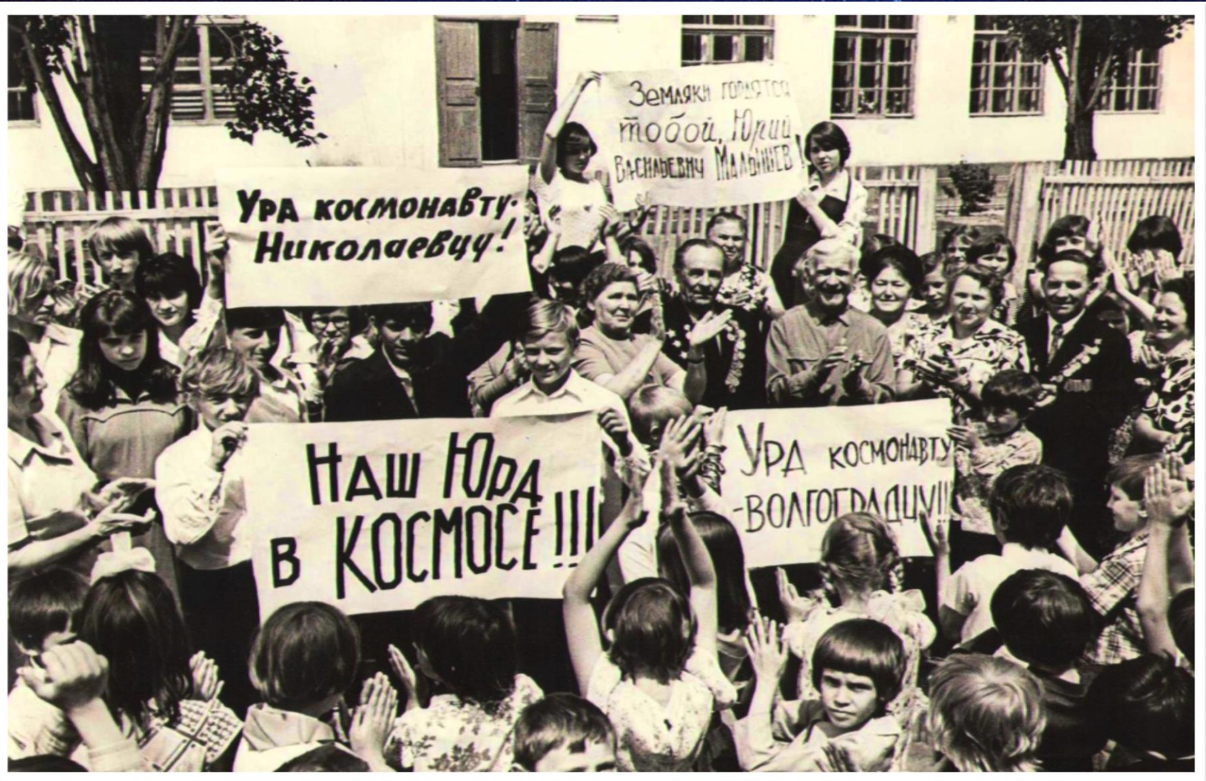
Митинг в восьмилетней школе № 3, посвященный запуску корабля «Союз Т-2», с командиром корабля Ю.В. Малышевым, бывшим воспитанником этой школы г. Николаевск. 6 июня 1980 г. // Ф. 13226. Оп. 1. Д. 155. Л. 12.