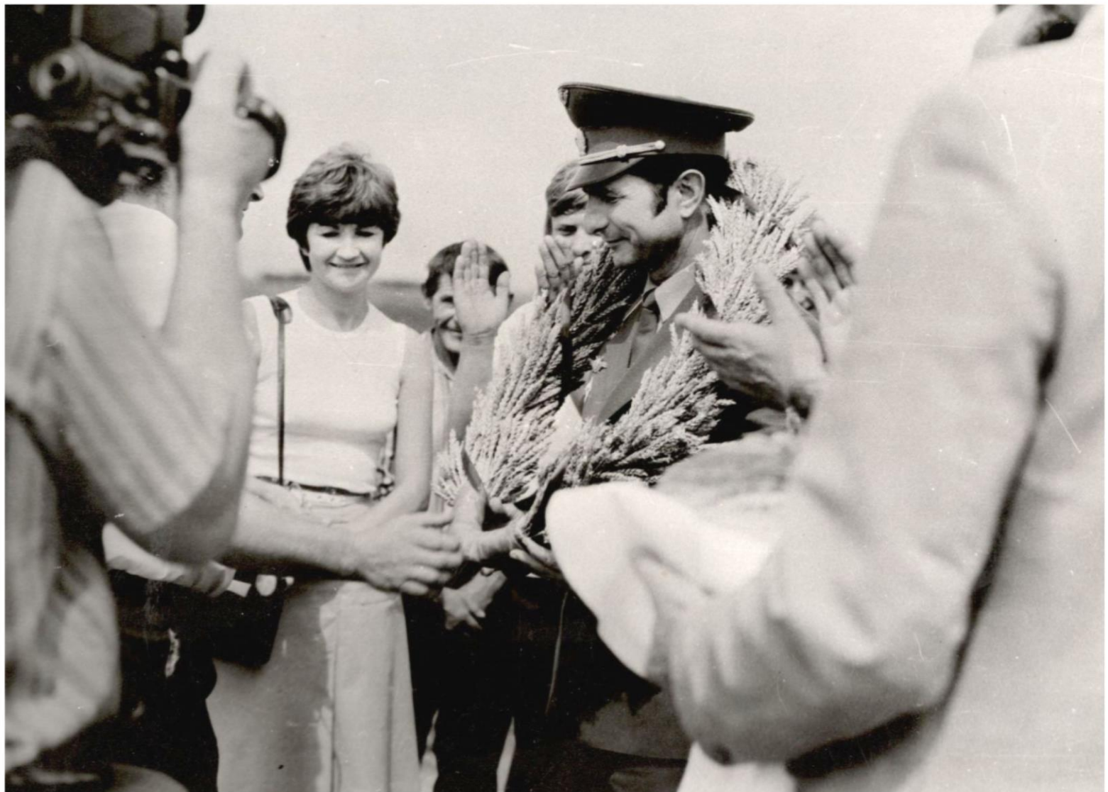
Пребывание Героя Советского Союза – космонавта Ю.В. Малышева на родине в Николаевском районе на «Поле Космонавта» в совхозе "Мелиоратор" Август 1980 г. // Ф. 13226. Оп. 1. Д. 155. Л. 5.