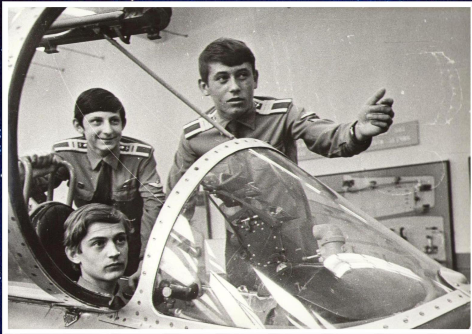
Члены клуба юных космонавтов-качинцев на занятиях в Качинском училище. г. Волгоград, 1985 г. // Ф. 13226. Оп. 1. Д. 2552.