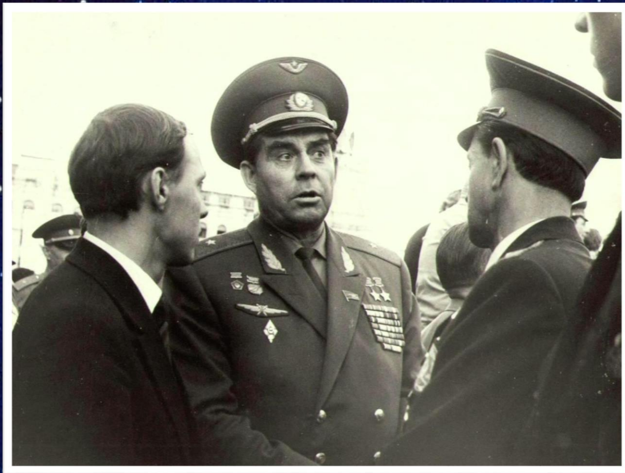
Дважды Герой Советского Союза, летчик-космонавт – Георгий Тимофеевич Береговой беседует с комсомольцами, участниками VII Всесоюзного слета победителей походов по местам революционной, боевой и трудовой славы советского народа