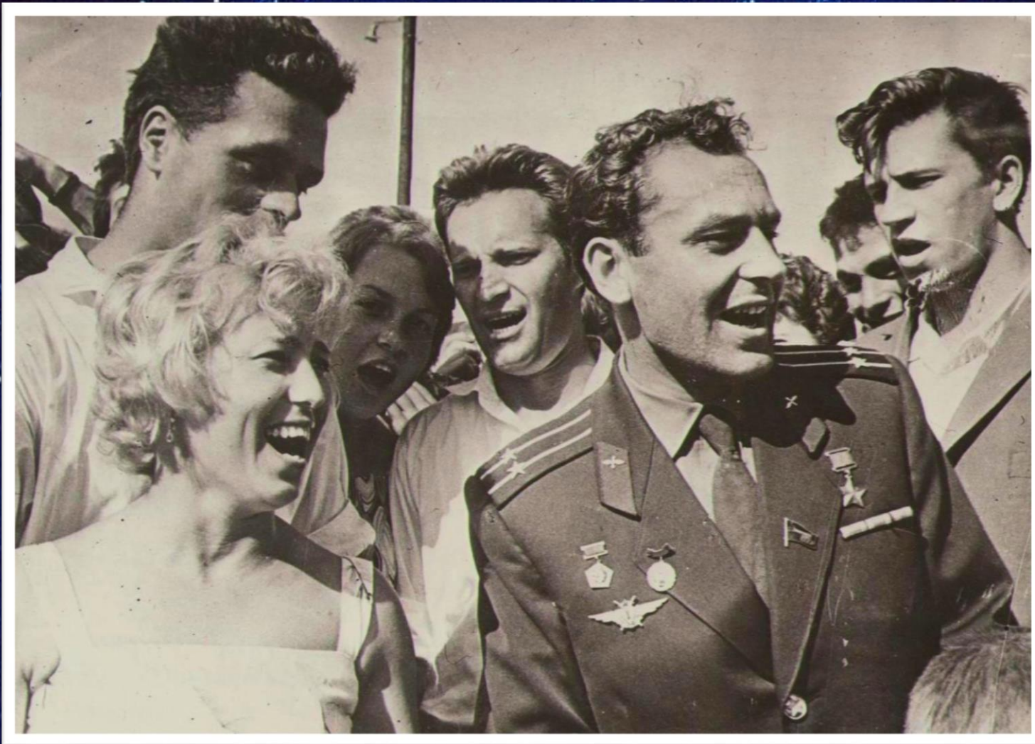
Герман Степанович Титов среди комсомольцев г. Волжского. Август 1963 г. // Ф. 13226. Оп. 1. Д. 2398.