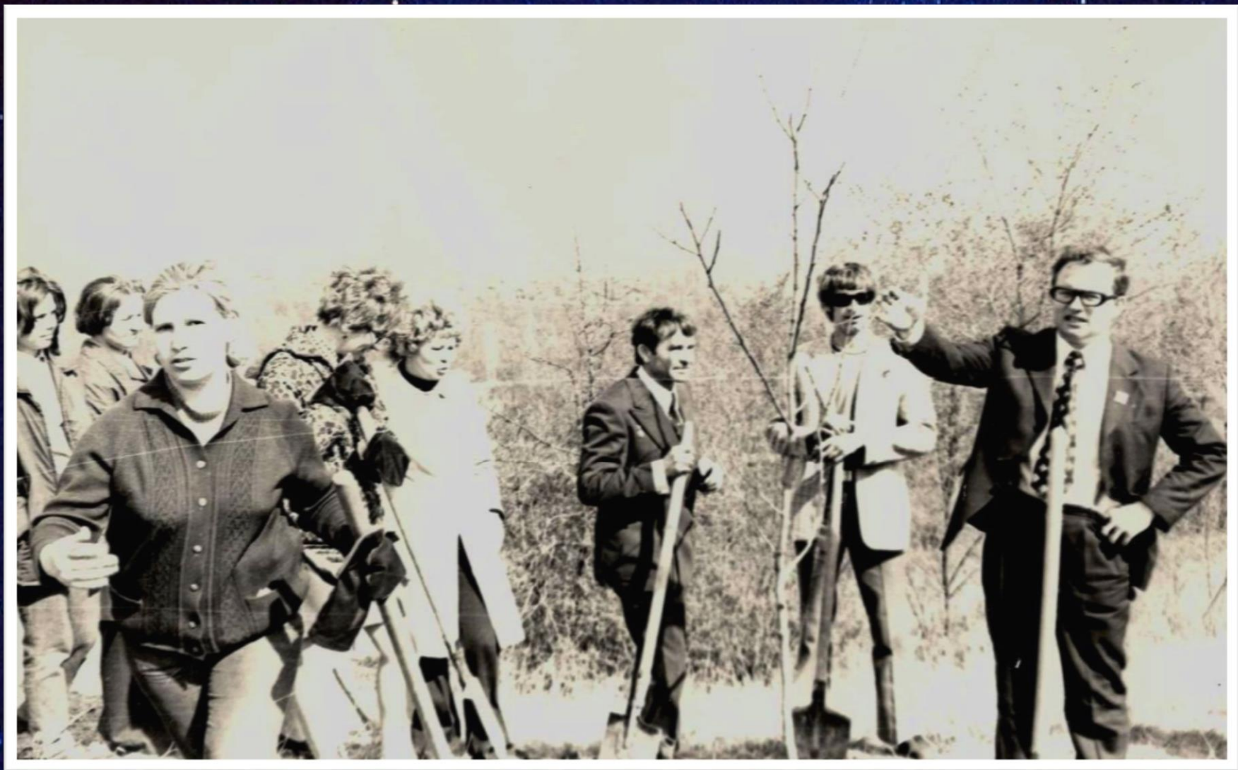
Комсомольцы Краснооктябрьского района вместе с космонавтом О. Макаровым на Ленинском субботнике на Мамаевом кургане г. Волгоград, 1975 г. // Ф. 13226 Оп. 1. Д. 520. Л. 1.