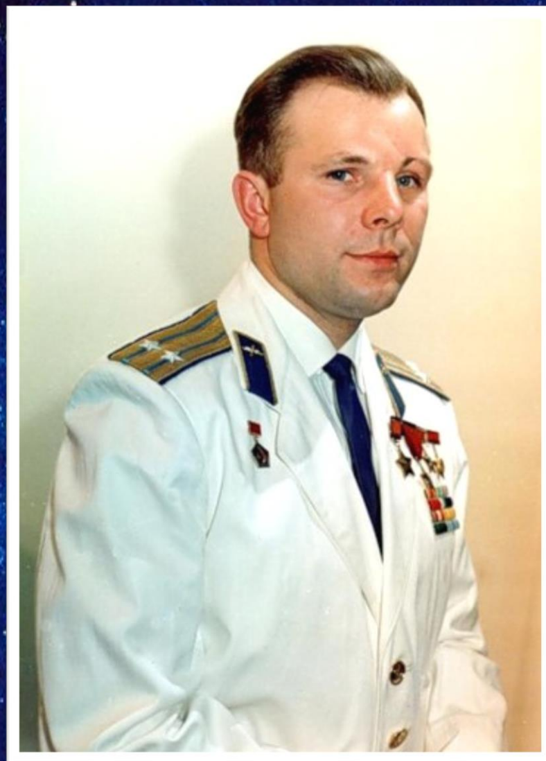
Первый в истории покоритель космоса – Юрий Алексеевич Гагарин