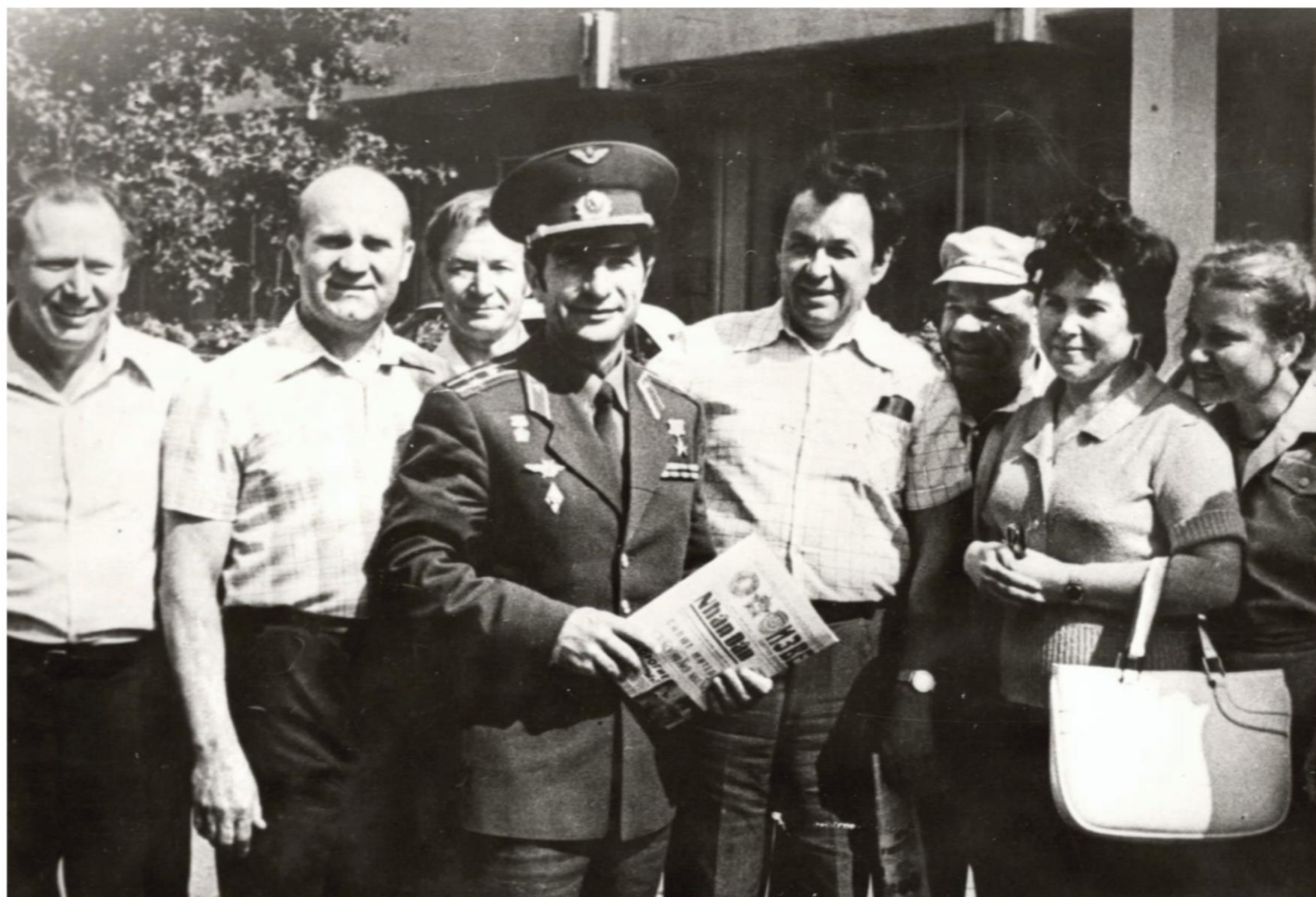
Космонавт Ю.В. Малышев среди журналистов. Волгоград, 1980 г. // Ф. 13226. Оп. 1. Д. 66. Л. 6.