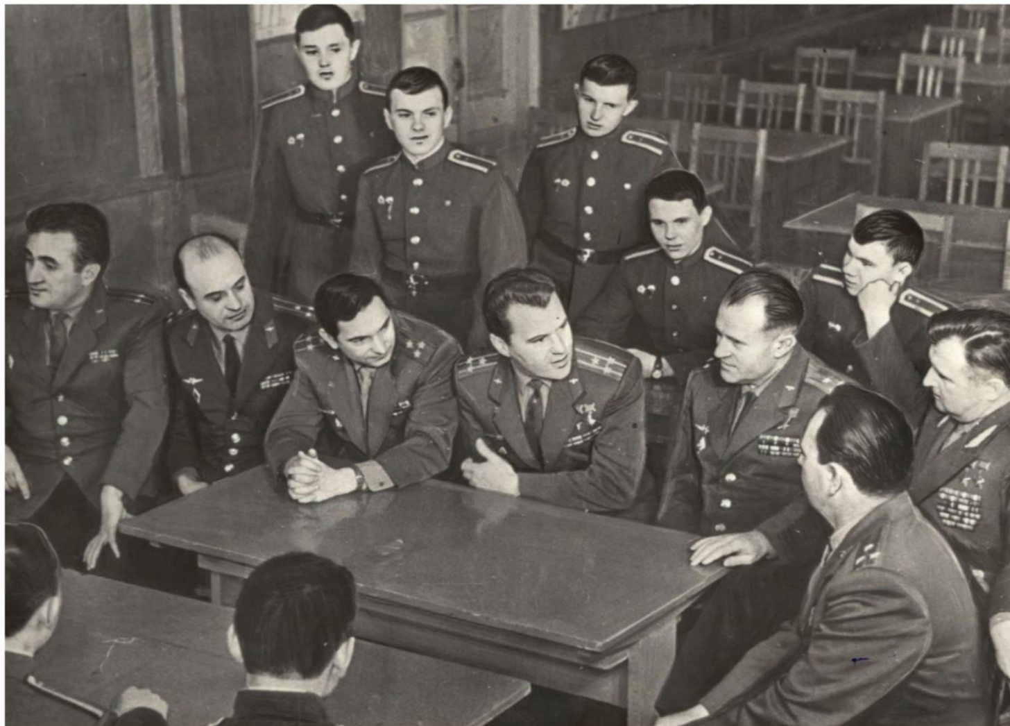
Встреча учащихся Качинского училища с выпускником училища Героем Советского Союза летчиком-космонавтом Валерием Федоровичем Быковским. 1964 г. // Ф. 13226. Оп. 1. Д. 227. Л. 1.