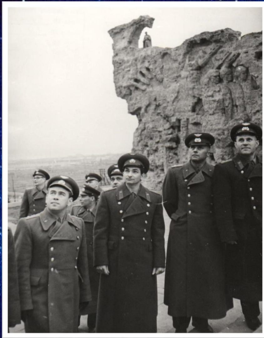
Летчик-космонавт СССР В.Ф. Быковский в Волгограде на Мамаевом кургане. 1964 г. // Ф. 13226. Оп. 1. Д. 1456 1 Л. 3.