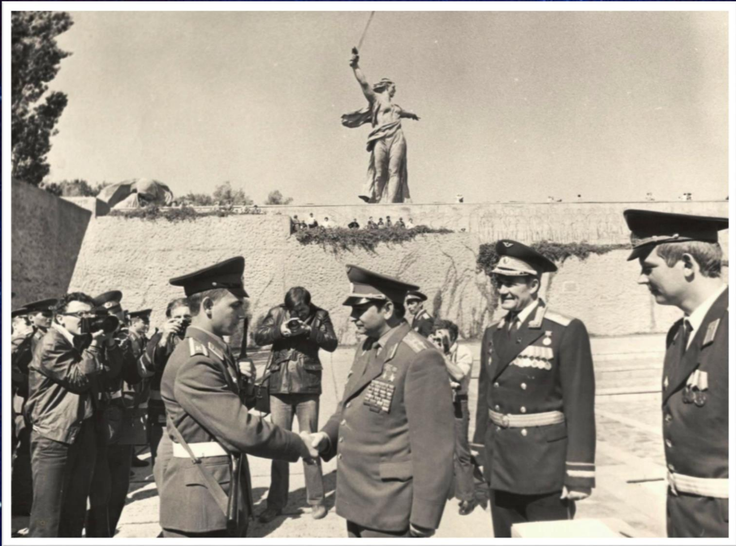
Валерий Фёдорович Быковский – летчик-космонавт СССР, дважды Герой Советского Союза, выпускник Качинского училища среди молодых качинцев на Мамаевом кургане. г. Волгоград, 1975 г. // Ф. 13226. Оп. 1 Д. 651. Л. 1.