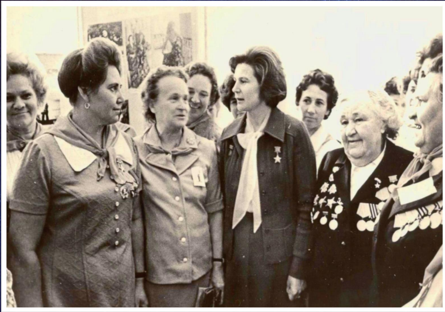
Председатель Комитета Советских женщин, Герой Советского Союза, космонавт В.В. Терешкова беседует с активом женщин г. Волгограда. 1976 г. // Ф. 13226. Оп. 1. Д. 43. Л. 1.