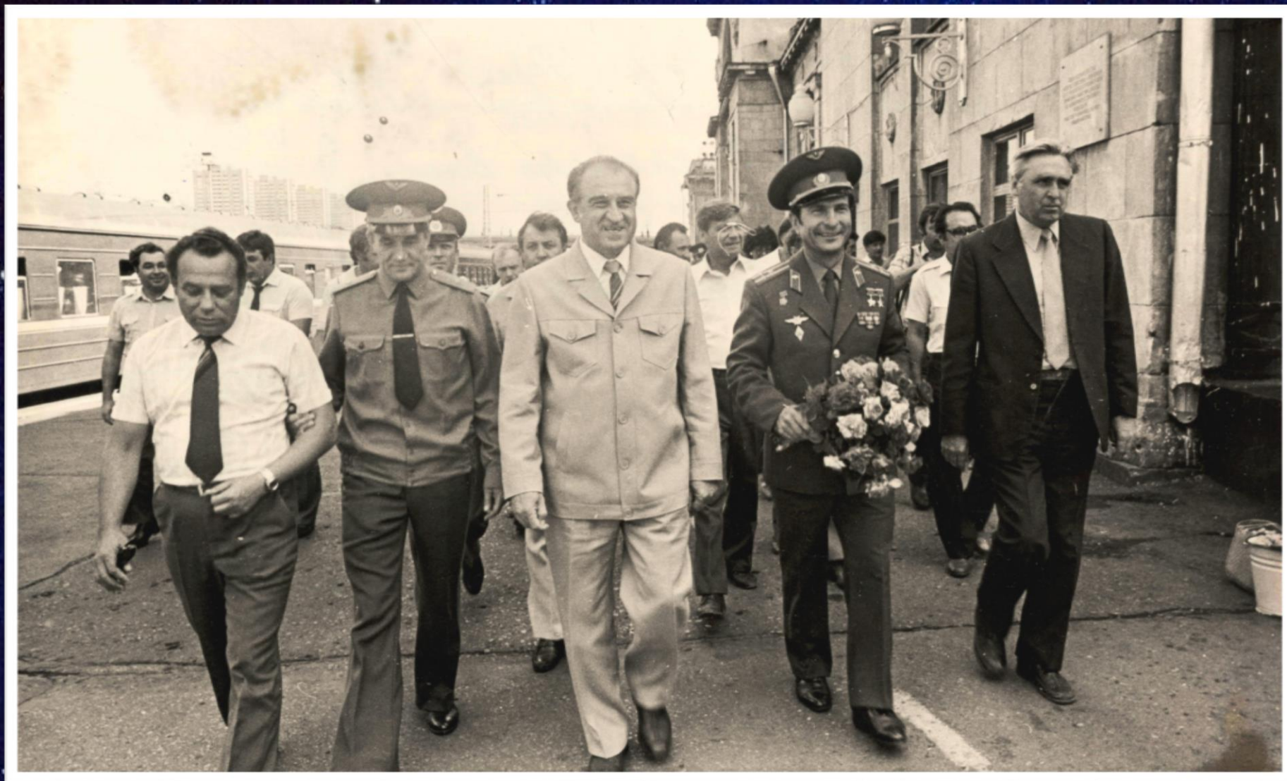
Летчик-космонавт, дважды Герой Советского Союза Ю.В. Малышев в Волгограде. 1984 г. // Ф. 13226. Оп. 1. Д. 2035. Л. 1.