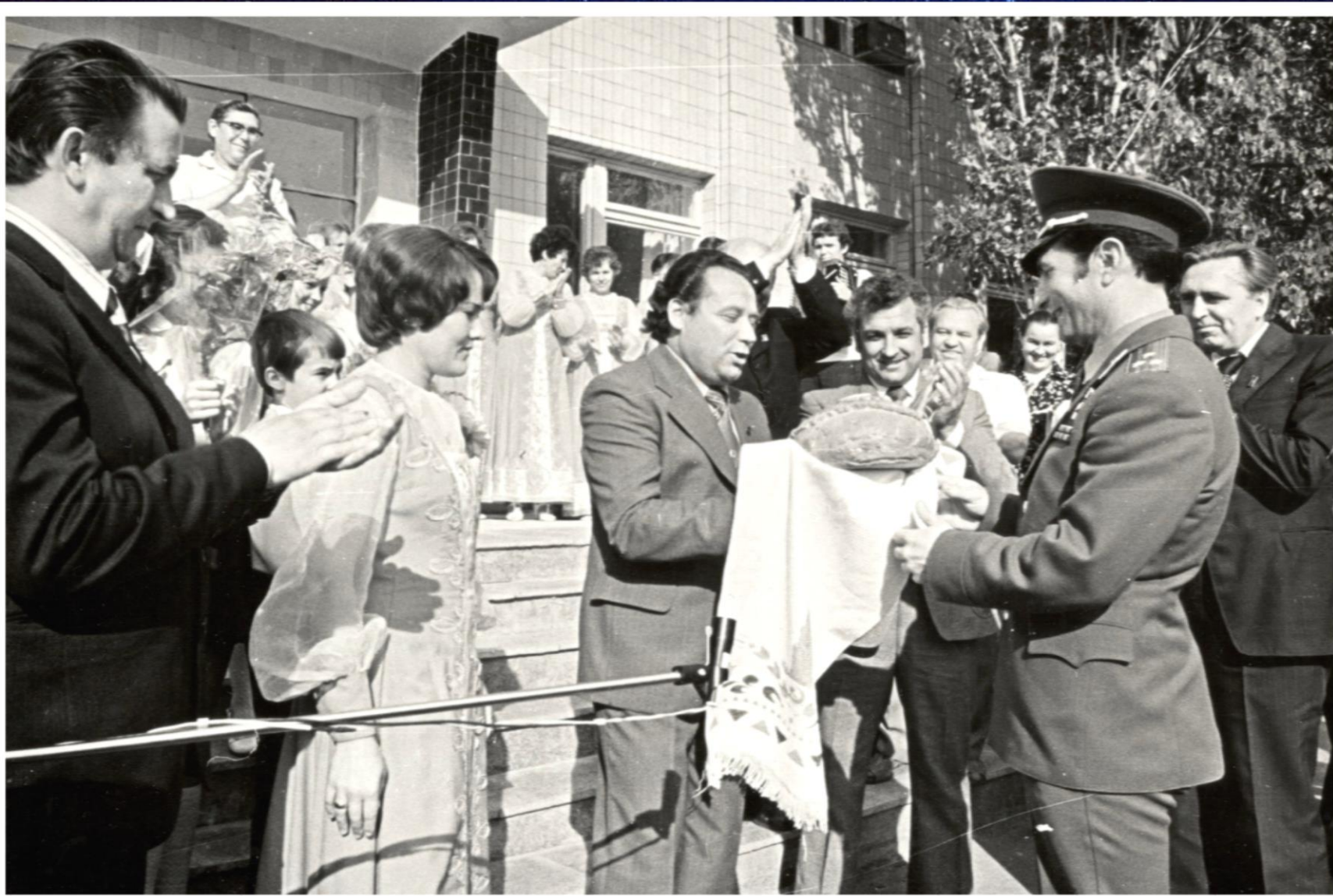
Летчик-космонавт, дважды Герой Советского Союза Ю.В. Малышев на родине в г. Николаевске. 1984 г. // Ф. 13226. Оп. 1. Д: 2035. Л. 4.