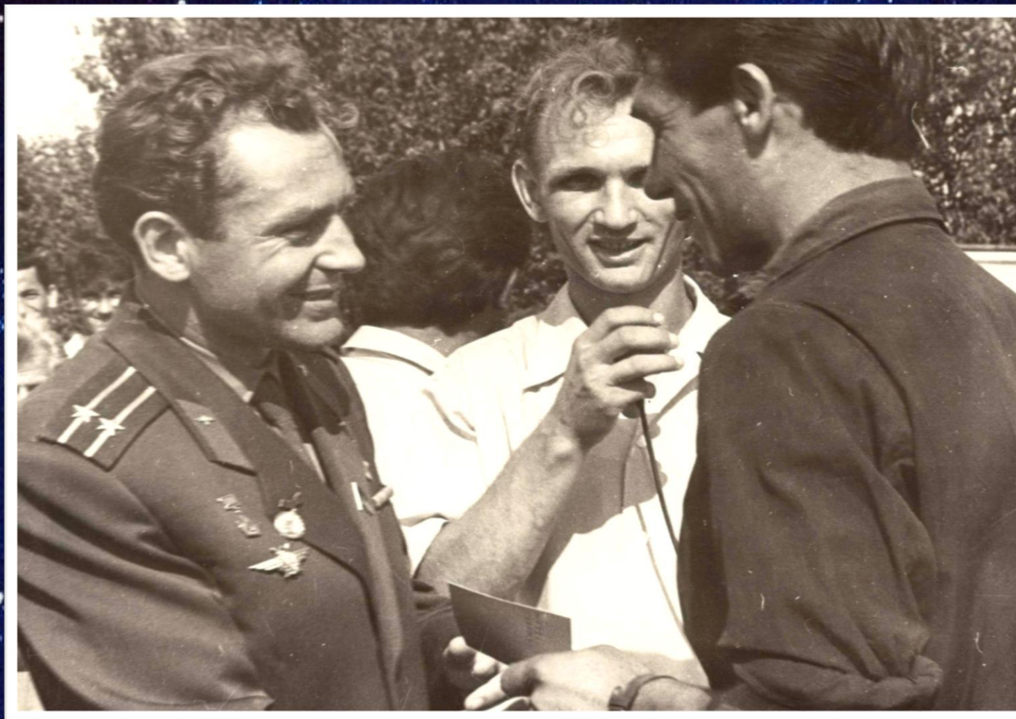
Вручение комсомольской путевки на строительство Волжского химкомбината летчику-космонавту СССР Г.С. Титову г. Волжский, август 1963 г. // Ф. 13226. Оп. 1. Д. 1457.