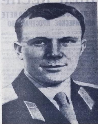
Первый пилот-космонавт Юрий Гагарин